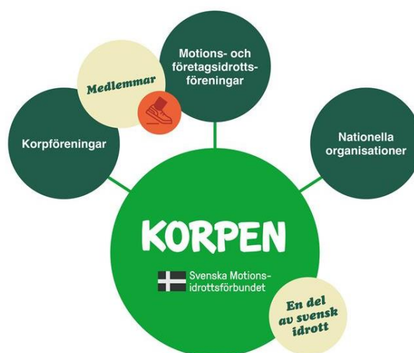
Figur: Anslutningsformer Korpen Svenska Motionsidrottsförbundet

Korpen Svenska Motionsidrottsförbundet finns för att främja rörelsens och medlemmarnas gemensamma intressen och för att förvalta Korpen Svenska Motionsidrottsförbundets idé. Att leda, driva på och samordna vårt gemensamma utvecklingsarbete, i linje med de gemensamma beslut vi fattar i demokratisk ordning är ett av våra viktigaste verksamhetsområden.